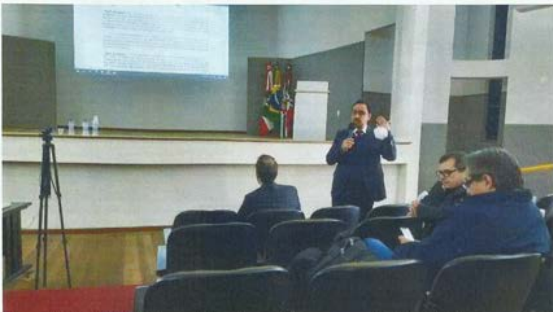
Figura 15. Comitê da Bacia participa de reunião com Grupo Técnico de Assessoramento GTA em Criciúma. Data: 18/07/2022. Local: SATC/Criciúma.