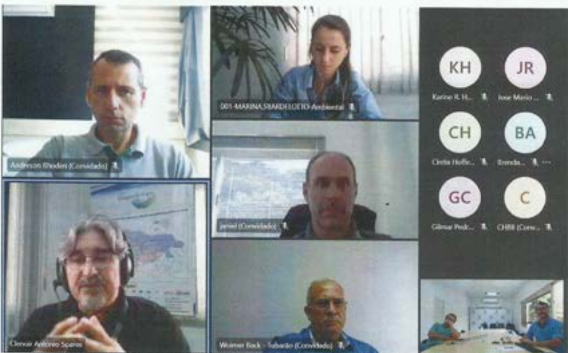
Figura 10. Comitê de Bacia participou da reunião do Fórum Catarinense de Comitês de Bacias. Data: 26/04/2022. Local: Videoconferência.