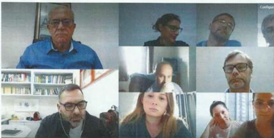
Figura 7. Comitê da Bacia participa de Assembleia do Conselho Consultivo do Parque Estadual da Serra Furada. Data: 12/04/2022. Local: Videoconferência.