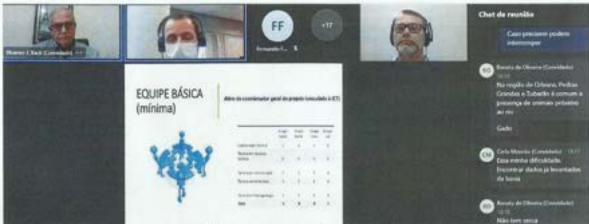
Figura 17. Assembleia Geral Ordinária. Data: 27/07/2022. Local: Videoconferência.