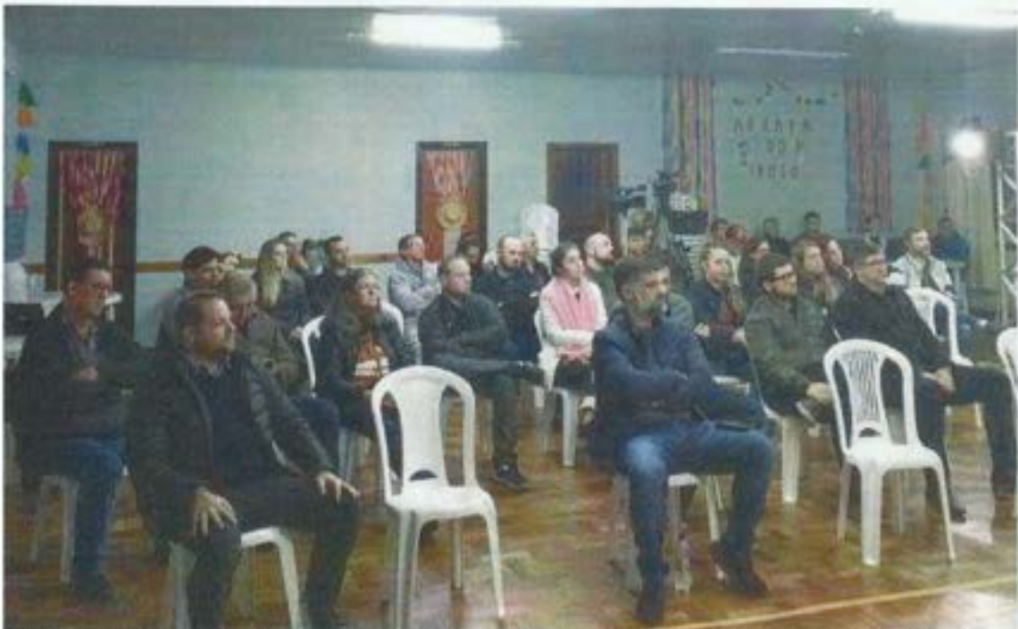
Figura 14. Comitê da Bacia Participa de Audiência Pública do Parque Estadual da Serra Furada. Data: 22/06/2022. Local: Centro de Convivência de Idosos, no Município de Grão-Pará.