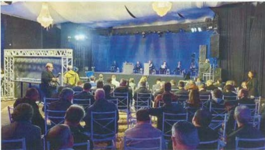
Figura 18. Comitê da Bacia entrega carta compromisso aos candidatos ao Governo de SC. Data: 08/08/2022. Local: -