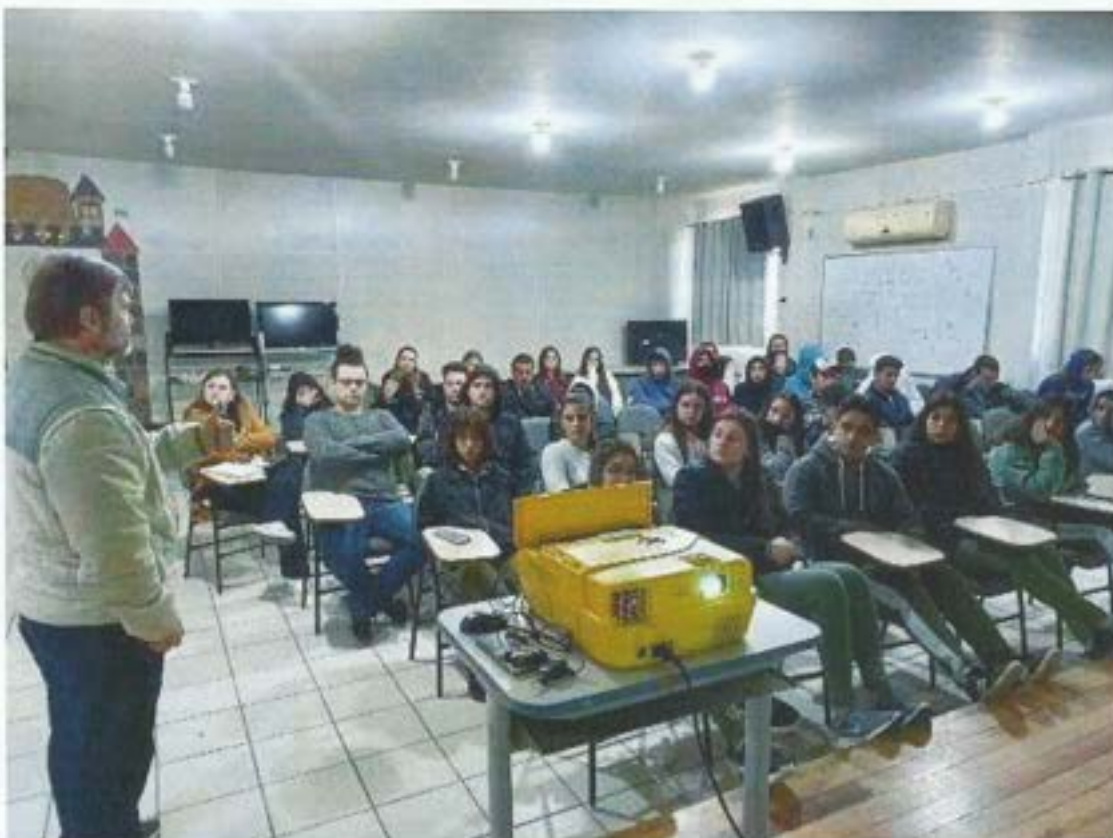
Figura 20. Comitê da Bacia faz palestra para alunos do Ensino Médio em Tubarão. Data: 25/08/2022. Local: EEB SANTO ANJO DA GUARDA – Tubarão.