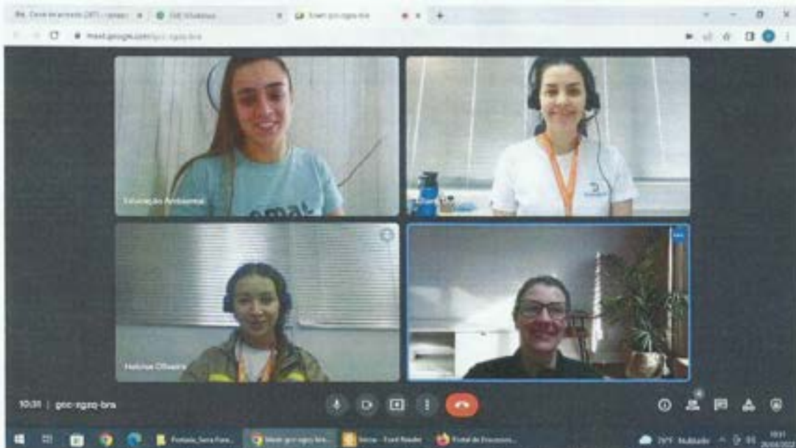
Figura 11. Câmara Técnica da Ed. Ambiental e Comunicação do Comitê da Bacia realiza reunião. Datas: 25/04 e 10/05/2022. Local: Videoconferência.