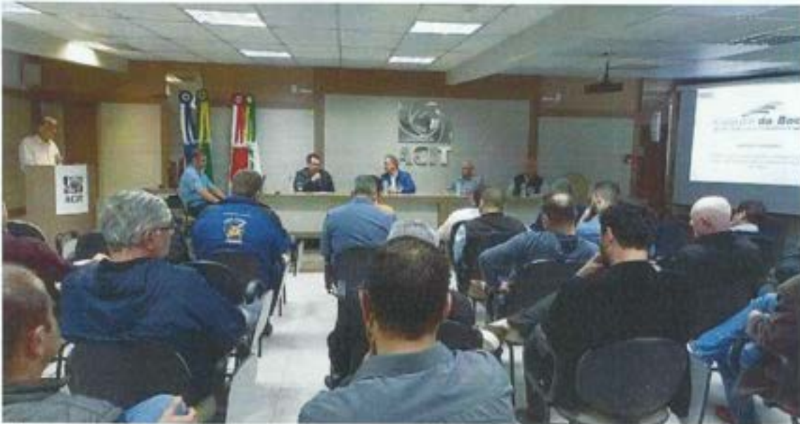
Figura 19. Comitê da Bacia faz palestra no Workshop-Rio Tubarão. Data: 04/08/2022. Local: Sede ACIT – Tubarão.