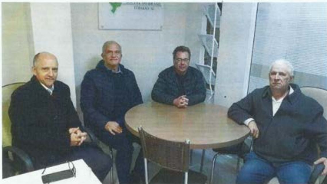
Figura 12. Comitê da Bacia apresenta trabalhos para os membros do Observatório Social. Data: Maio-Junho/2022. Local: Observatório Social do município de Tubarão.