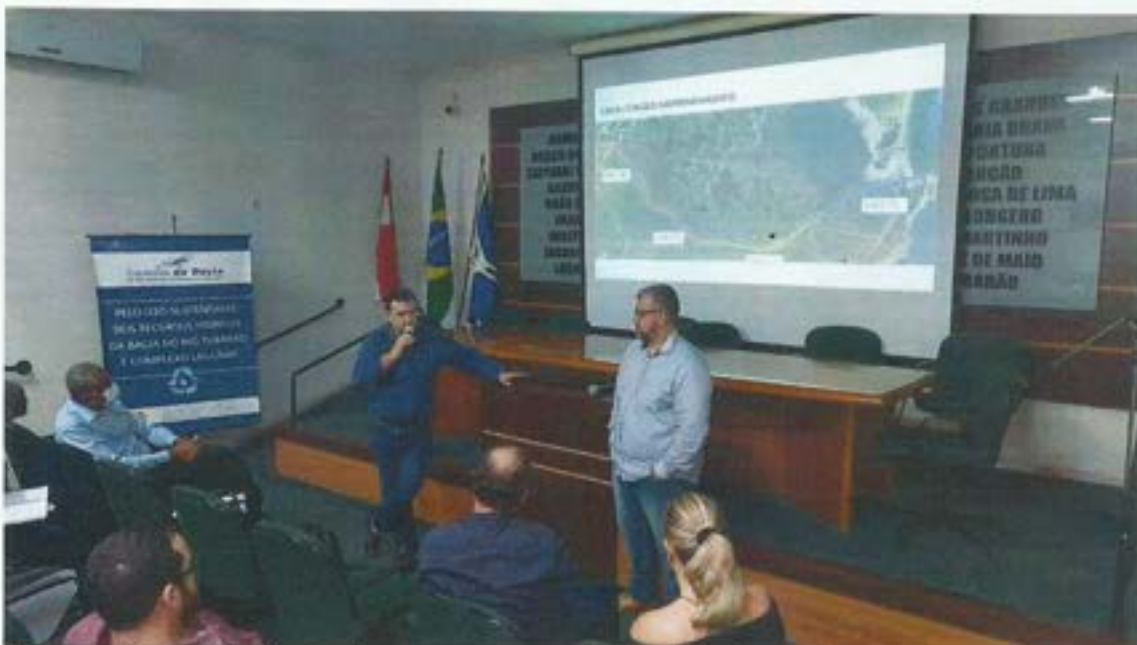
Figura 6. Comitê da Bacia presente no Seminário da Enchente de 1974. Data: 24/03/2022. Local: Sede da AMUREL – Tubarão.