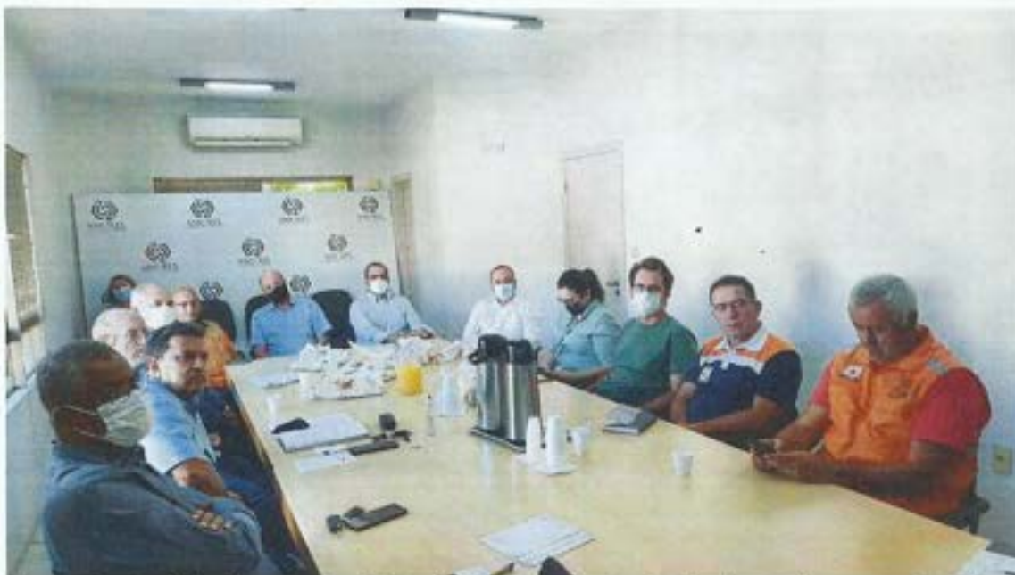
Figura 4. Comitê da Bacia participa de reunião da Comissão de Redragagem do Rio Tubarão. Data: 17/03/2022. Local: Sede da AMUREL – Tubarão.