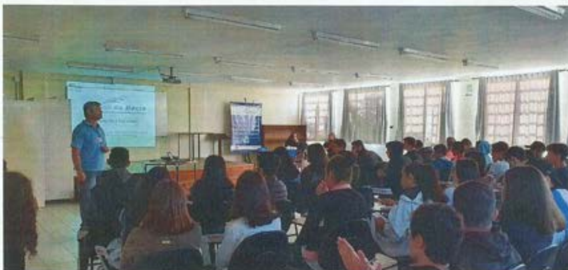
Figura 8. Comitê da Bacia faz palestra em escola de Tubarão. Data: Abril/2022. Local: EEB Lino Pessoa – Tubarão.