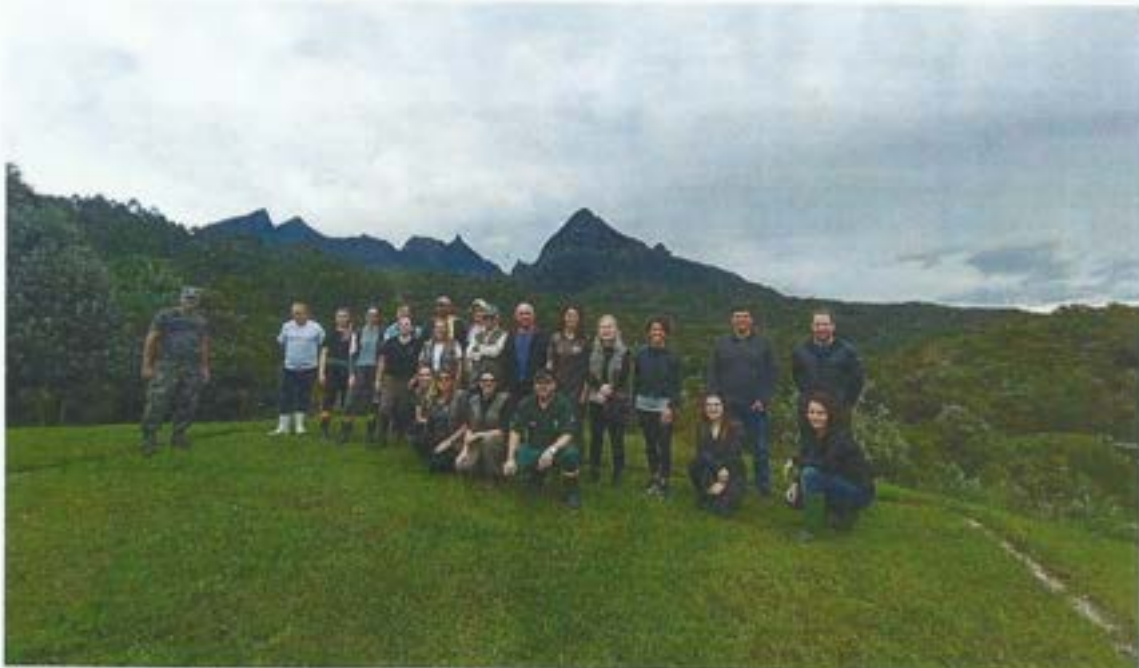
Figura 5. Membro do Comitê da Bacia visita Parque Estadual da Serra Furada. Data: 25/03/2022. Local: Parque Estadual da Serra Furada, localizada nos municípios de Grão-Pará e Orleans.