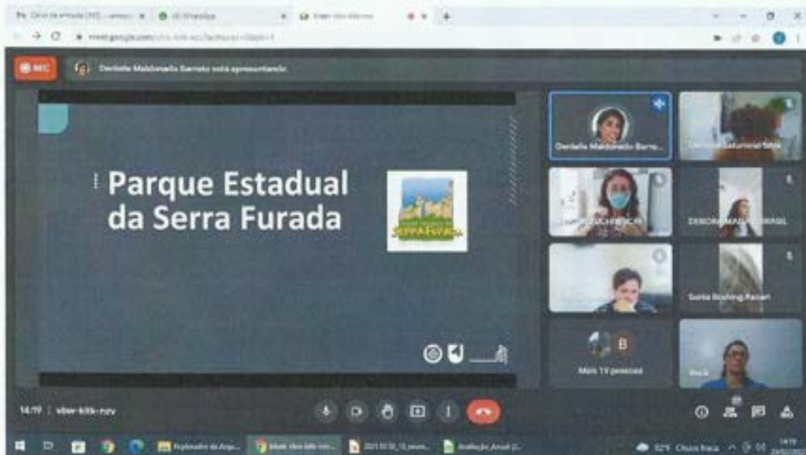
Figura 3. Comitê da Bacia participa de Assembleia do Conselho Consultivo do Parque da Serra Furada. Data: 23/02/2022. Local: Videoconferência.