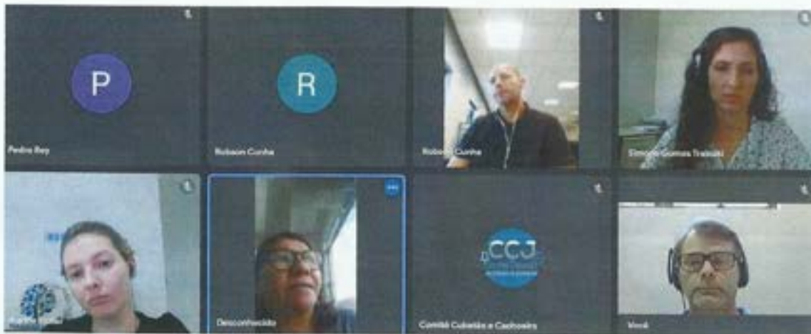
Figura 9. Comitê da Bacia participa de reunião com a Diretoria de Biodiversidade e Clima – DBIC. Data: Abril/2022. Local: Videoconferência.