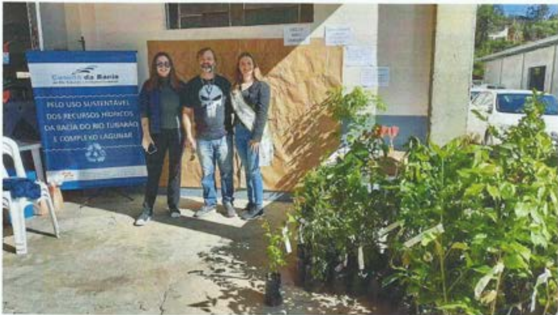
Figura 13. Amurel e Comitê da Bacia participam da Semana do Meio Ambiente em Santa Rosa de Lima. Data: 11/06/2022. Local: Município de Santa Rosa de Lima.