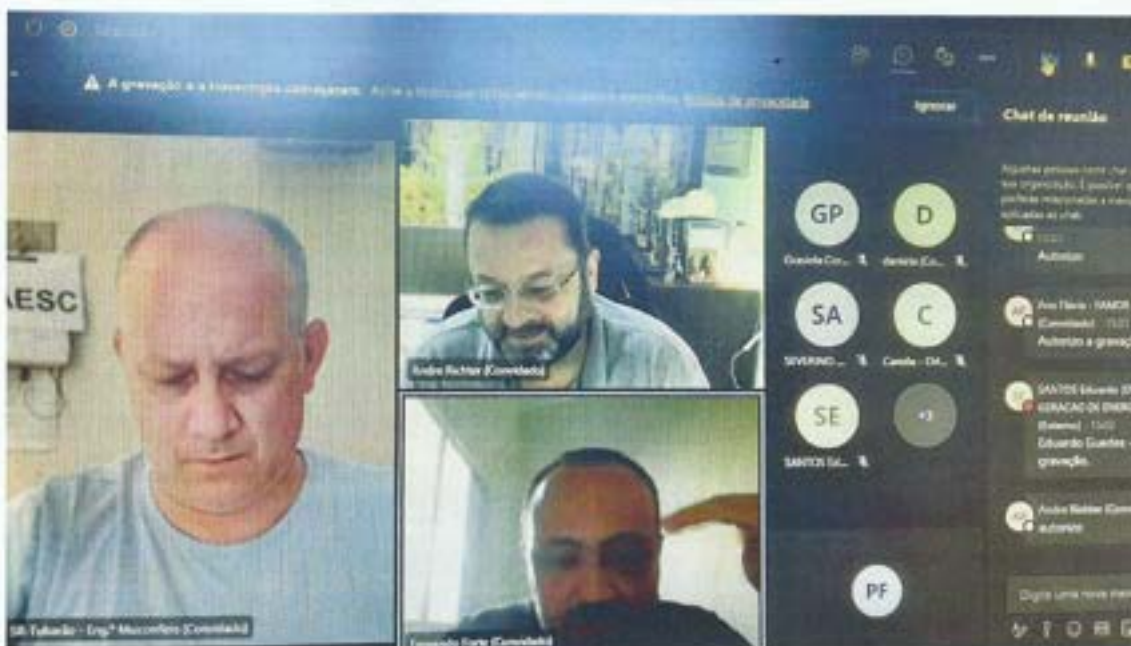
Figura 2: Reunião das Câmaras Técnicas de Áreas de Preservação Permanente (APPs) e Saneamento Ambiental. Data: 24/02/2022. Local: Videoconferência.