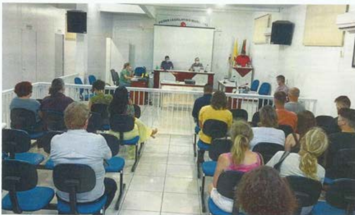
Figura 1. Comitê da Bacia participa de audiência pública sobre nova hidrelétrica no rio Braço do Norte. Data: 03/02/2022. Local: Câmara de Vereadores de Santa Rosa de Lima.